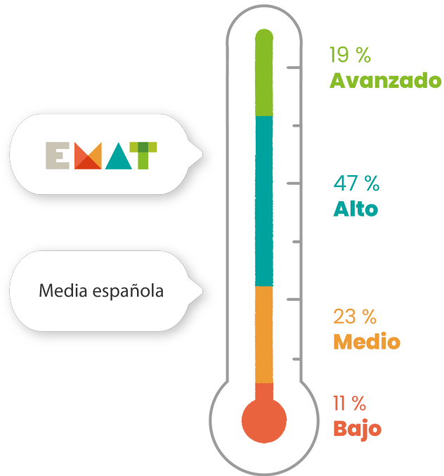
Gráfico 1. Porcentaje de alumnos en cada uno de los niveles de rendimiento matemático.

Después de haber analizado las pruebas de más de 6.000 alumnos, podemos concluir que los alumnos de EMAT han superado con notable éxito la prueba basada en el estudio TIMSS. La media a nivel escolar, de los alumnos que aprenden con EMAT, está en el nivel alto de rendimiento matemático. En el siguiente gráfico podemos observar el porcentaje de alumnos en cada uno de los niveles que establece TIMSS.