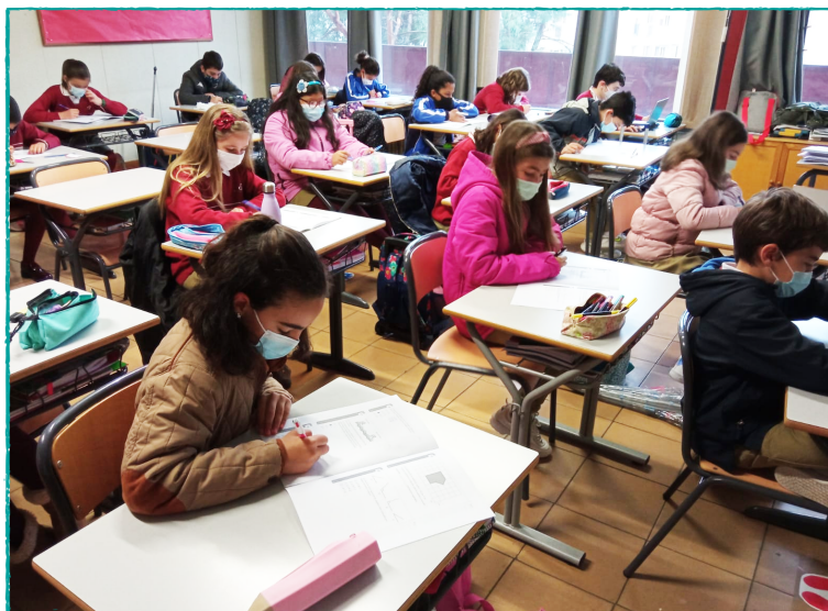
Alumnos del Colegio Sagrado Corazón de Guadalajara realizando la prueba.

sido aplicada en el aula sin un entrenamiento previo , como normalmente sucede cuando se aplica el estudio a nivel internacional. Así pues, los alumnos desconocían el formato, el contenido, no estaban acostumbrados a la duración de la prueba y no recibieron ayuda durante la misma.